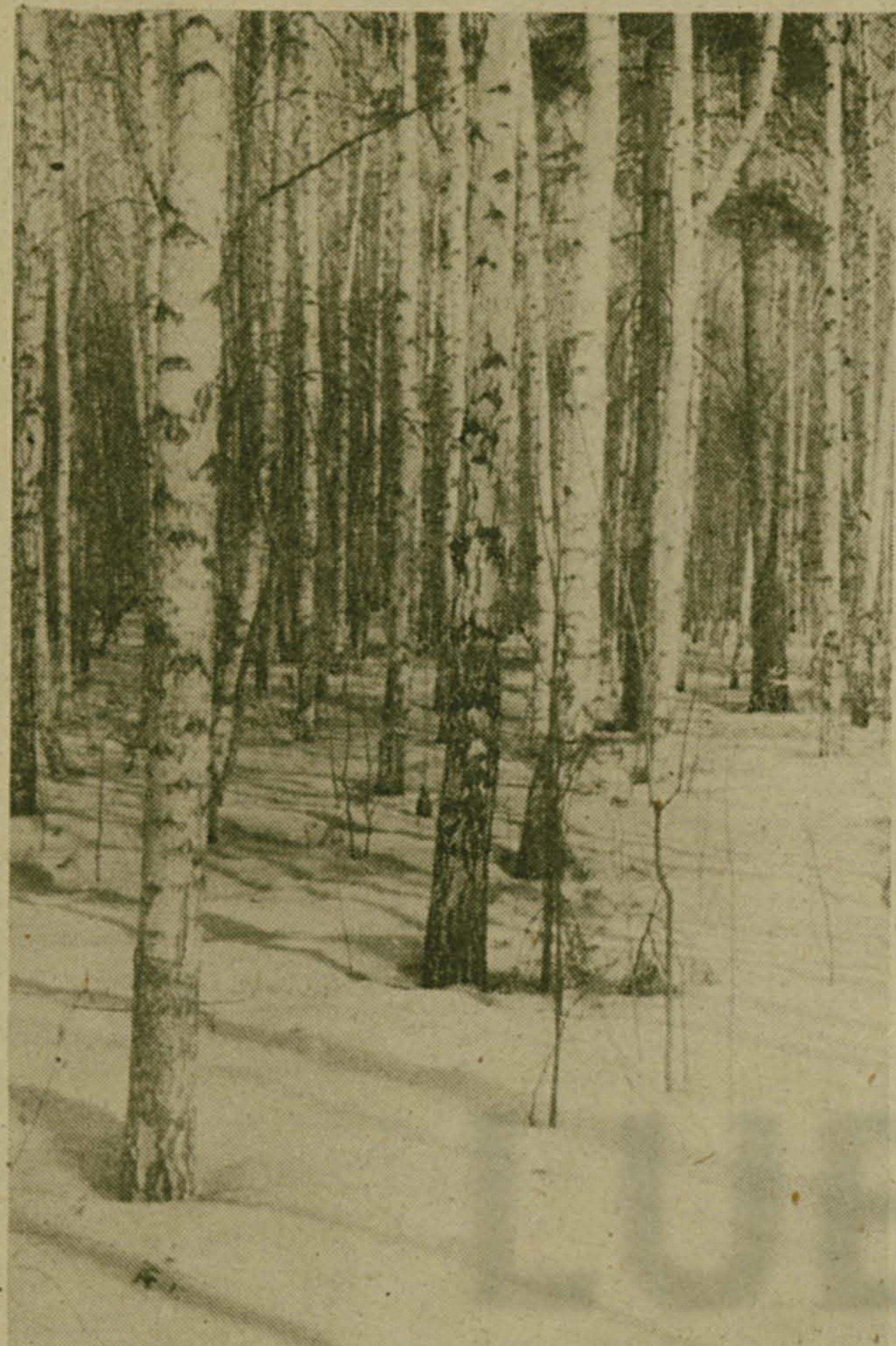
Зима в Подмоскovie.