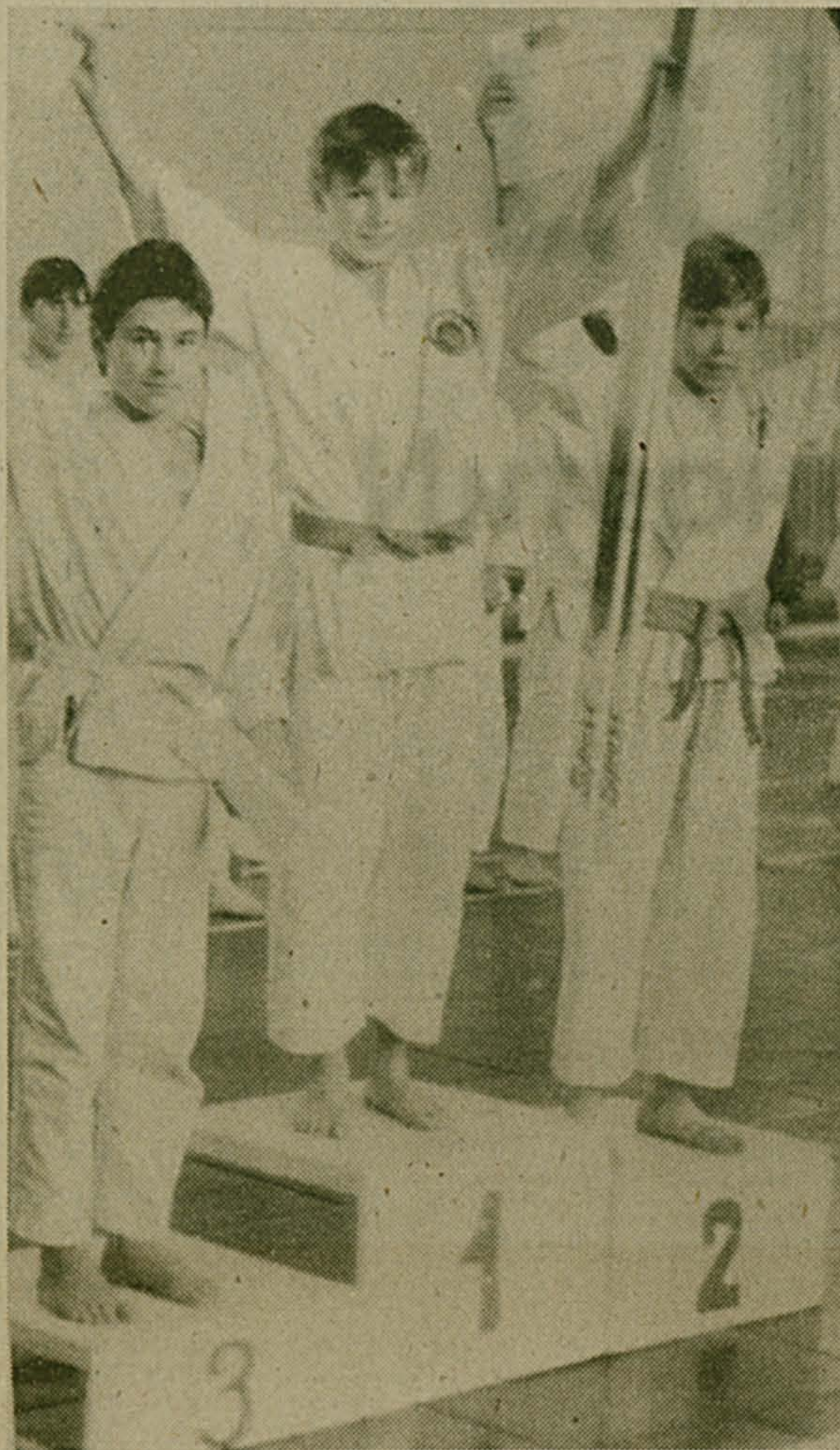
В морозные дни залы Люберецкого учебно-спортивного комбината и детско-юношеской спортивной школы были переполнены любителями спорта. Так бывает всегда, когда спор-

тивные мероприятия проводит городская федерация боевых искусств «Будо». В зрительском недостатка не было. Собралось очень много молодежи, и, конечно, пришли родители участников. А поглядеть действительно было на что.