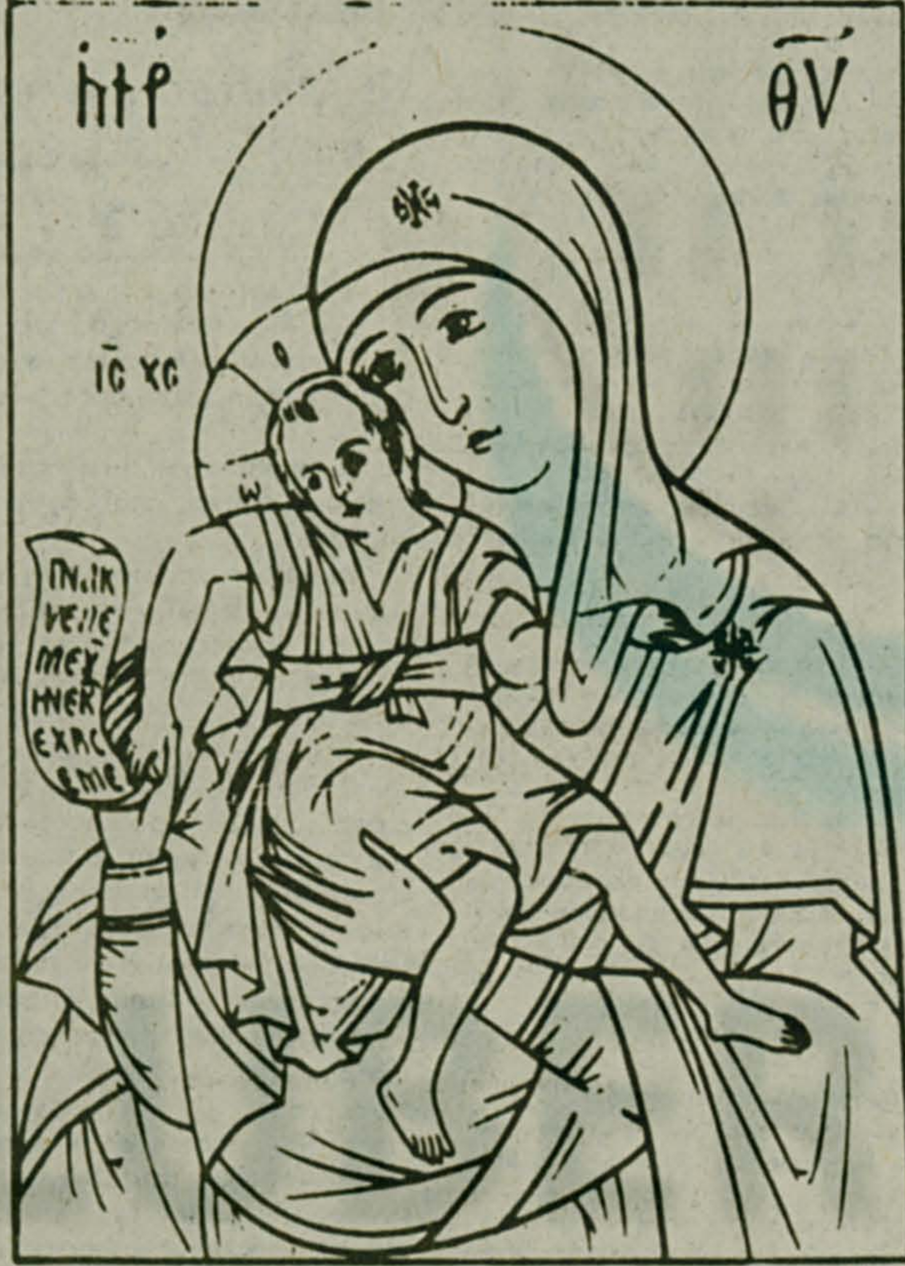
На снимке: рисунок иконы «Достоинно есть».

Эта икона находится в Карейской обители на горе Афон (Греция). События, связанные с ее прославлением чудотворной, относятся, по преданию, к X веку. Тогда в один из воскресных дней живший неподалеку от Кареи старец ушел в обитель на всенощное бдение. В келии остался один послушник. С наступлением ночи в дверь постучался неизвестный инок. Во время всенощной гость зашел «Достоинно есть», образ Богоматери просиял небесным светом, а послушник плакал от умиления. По его просьбе эта дивная песнь, за неимением бумаги, была записана на камне, размягчившемся, как воск, под рукой чудного певца. Назвав себя Гавриилом, странник стал невидимым. Икону, перед которой была впервые воспета «Достоинно есть», перенесли в храм Успения Богородицы Кареи, а плиту с начертанной на ней Архангелом Гавриилом песнью — в Константинополь. С. ШИШКИН.