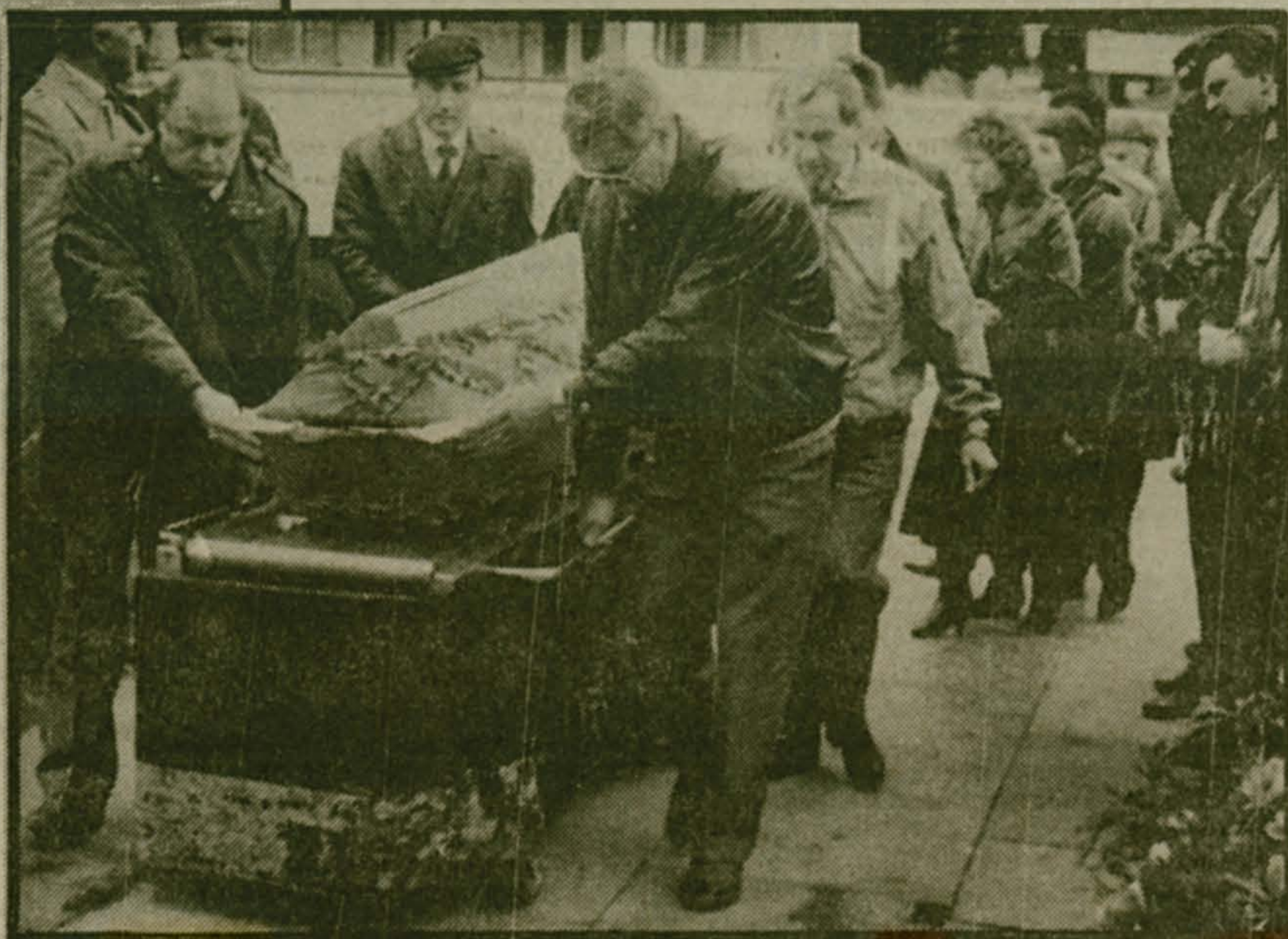
По статистике, здесь бываюи однажды: провожая кого-то или... Николо-Архангельский крематорий, ближайший к Люберцам