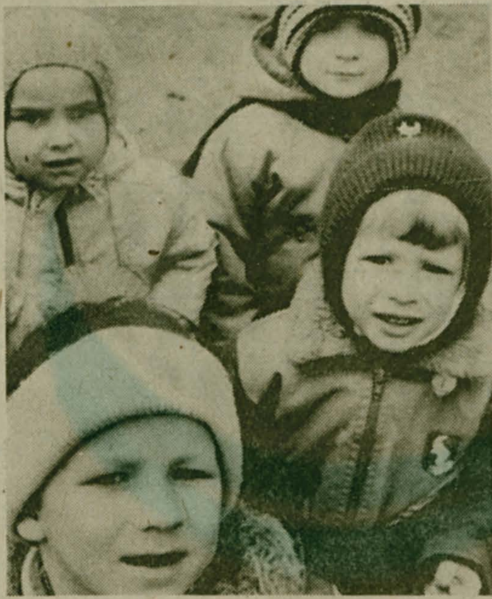
ВОСПИТАНИКОВ ЛЮБЕРЕЦКОГО ДЕТСКОГО ДОМА УСЫНОВЛЯЮТ И УДОЧЕРЯЮТ ИНОСТРАННЫЕ ГРАЖДАНЕ.