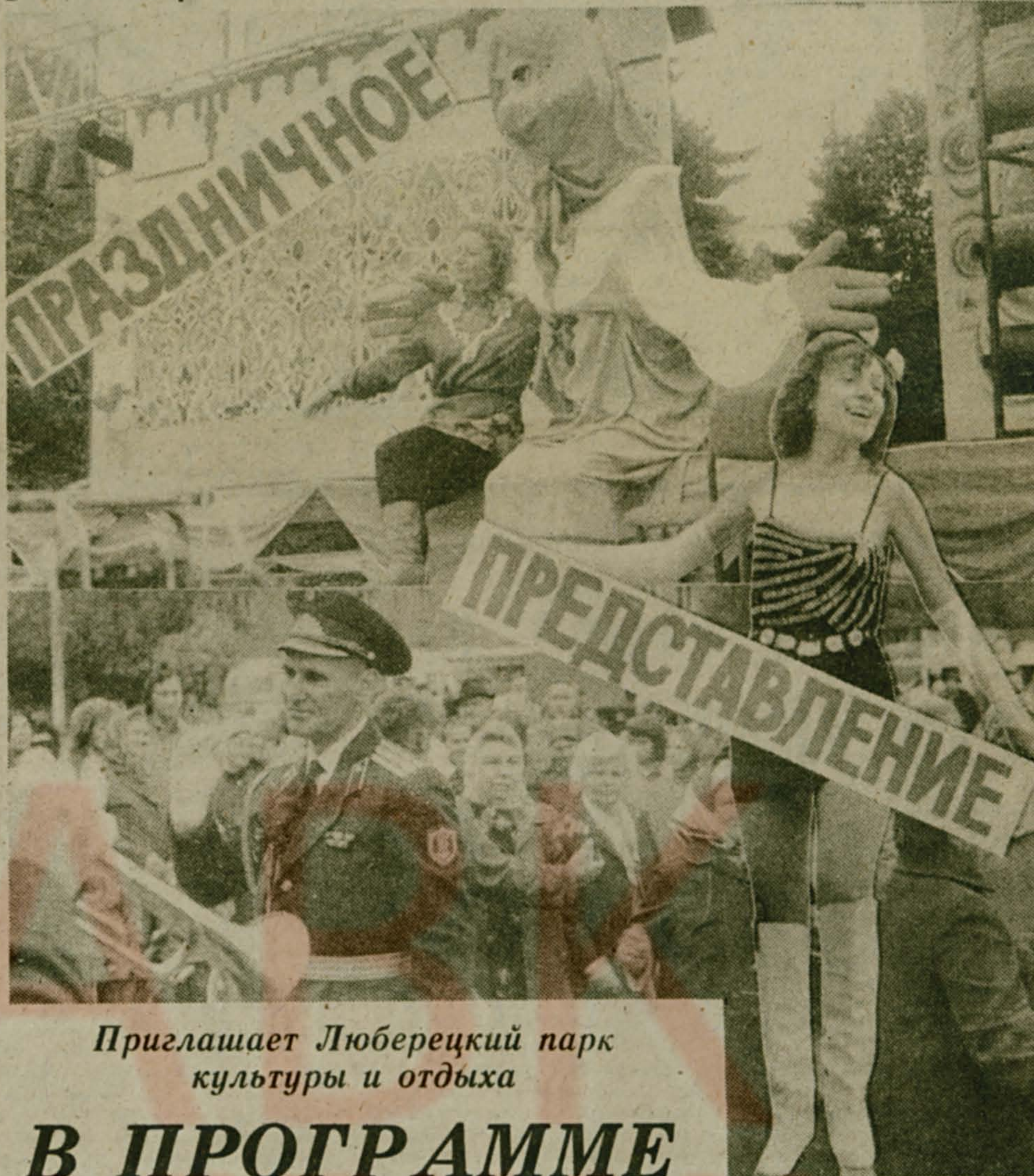
Приглашает Люберецкий парк культуры и отдыха