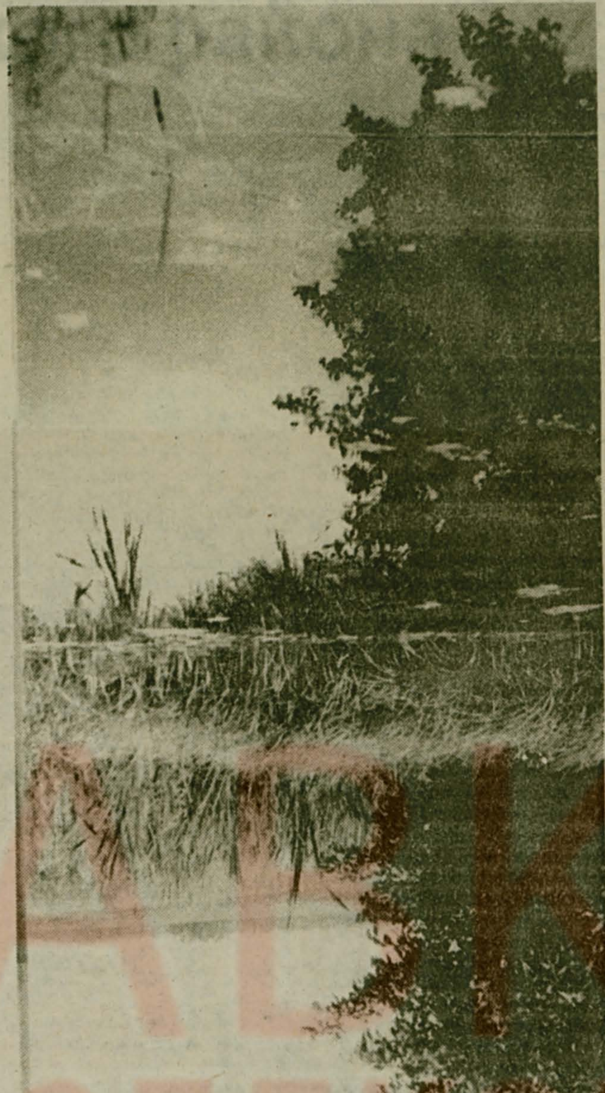
В жаркий полдень.