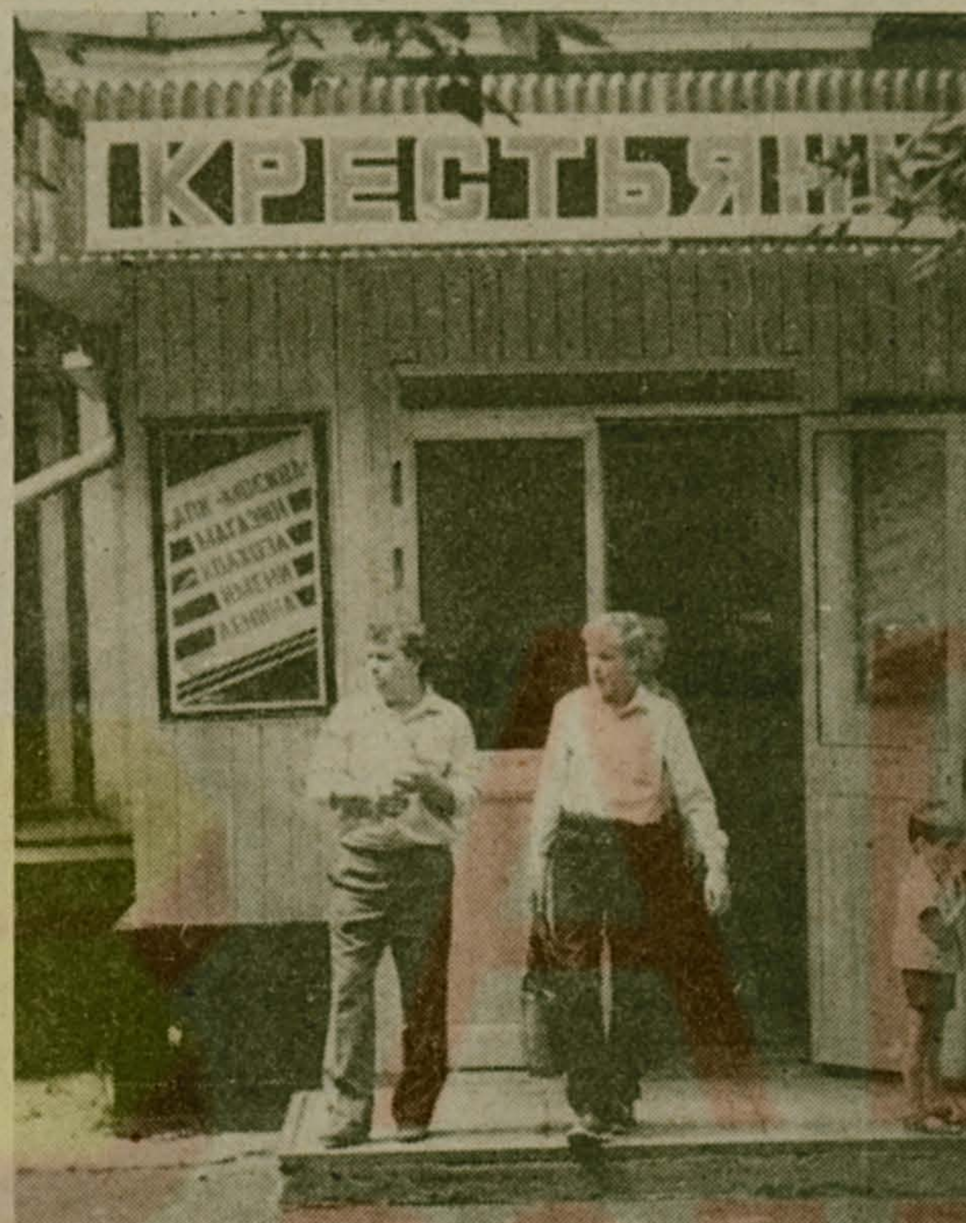
Как хороши, как свежи были...