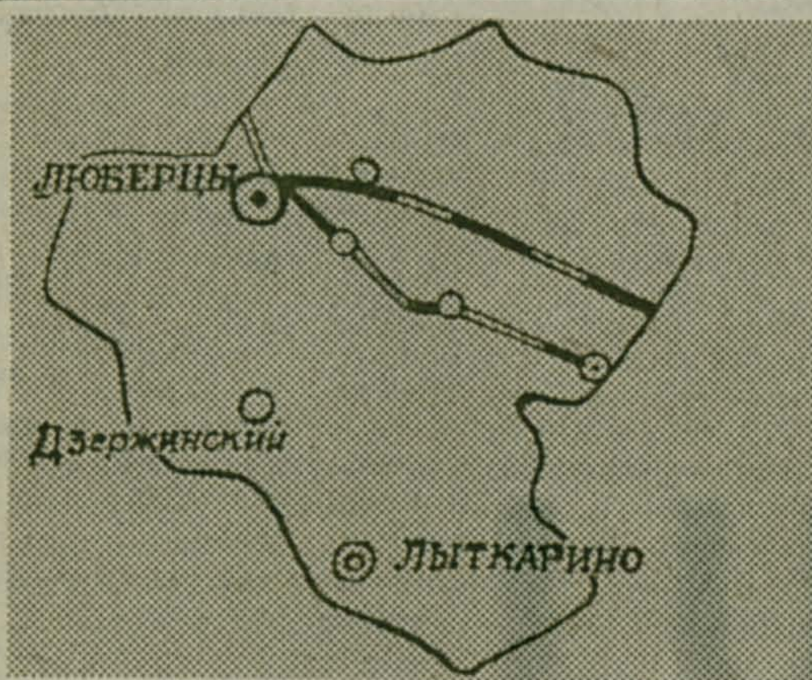
С нашей маркой