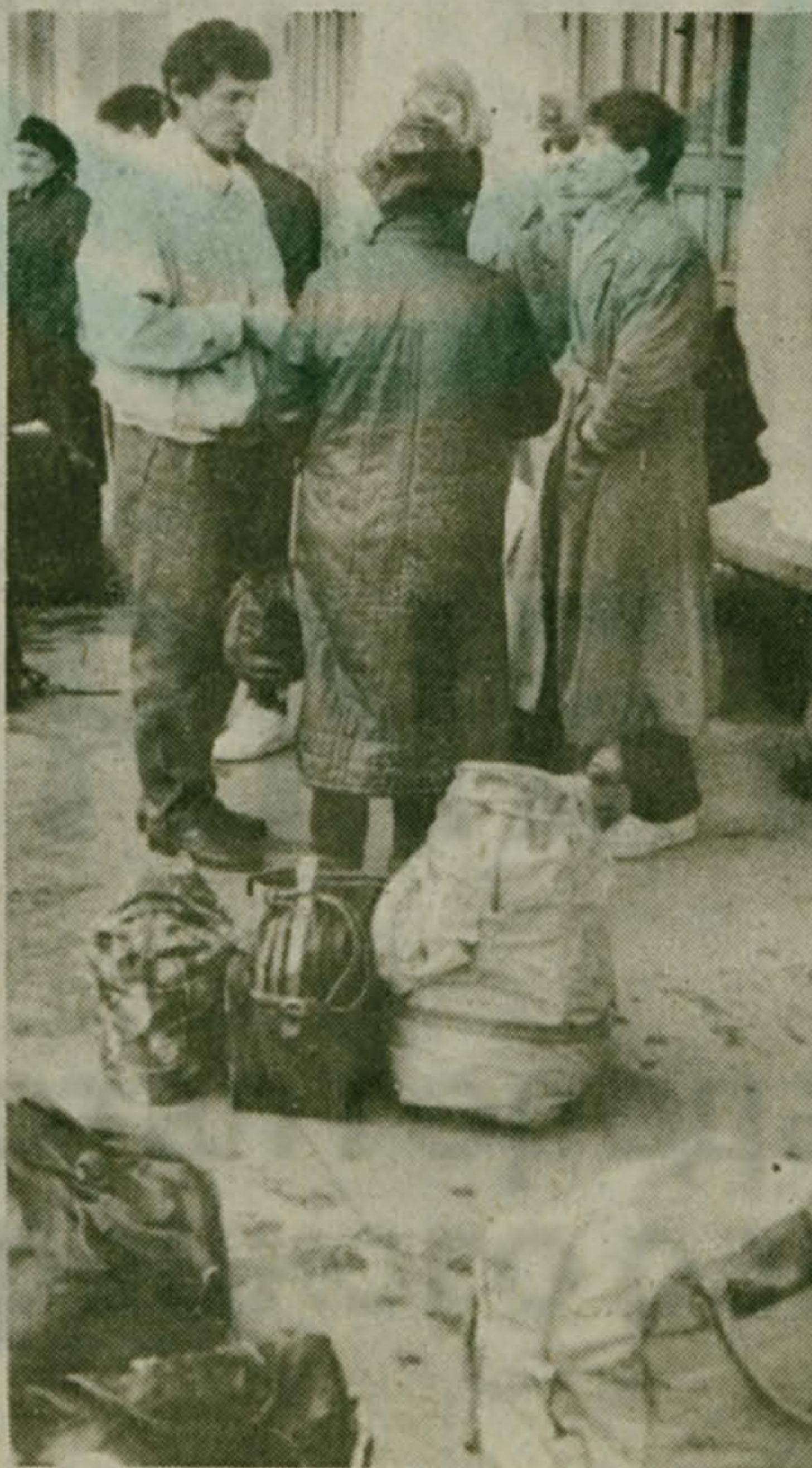
Четырнадцатого мая академический хор Люберецкого Дворца культуры отправился на автобусе с ответным визитом в город-побратим Дранск.

На снимке: перед отъездом.