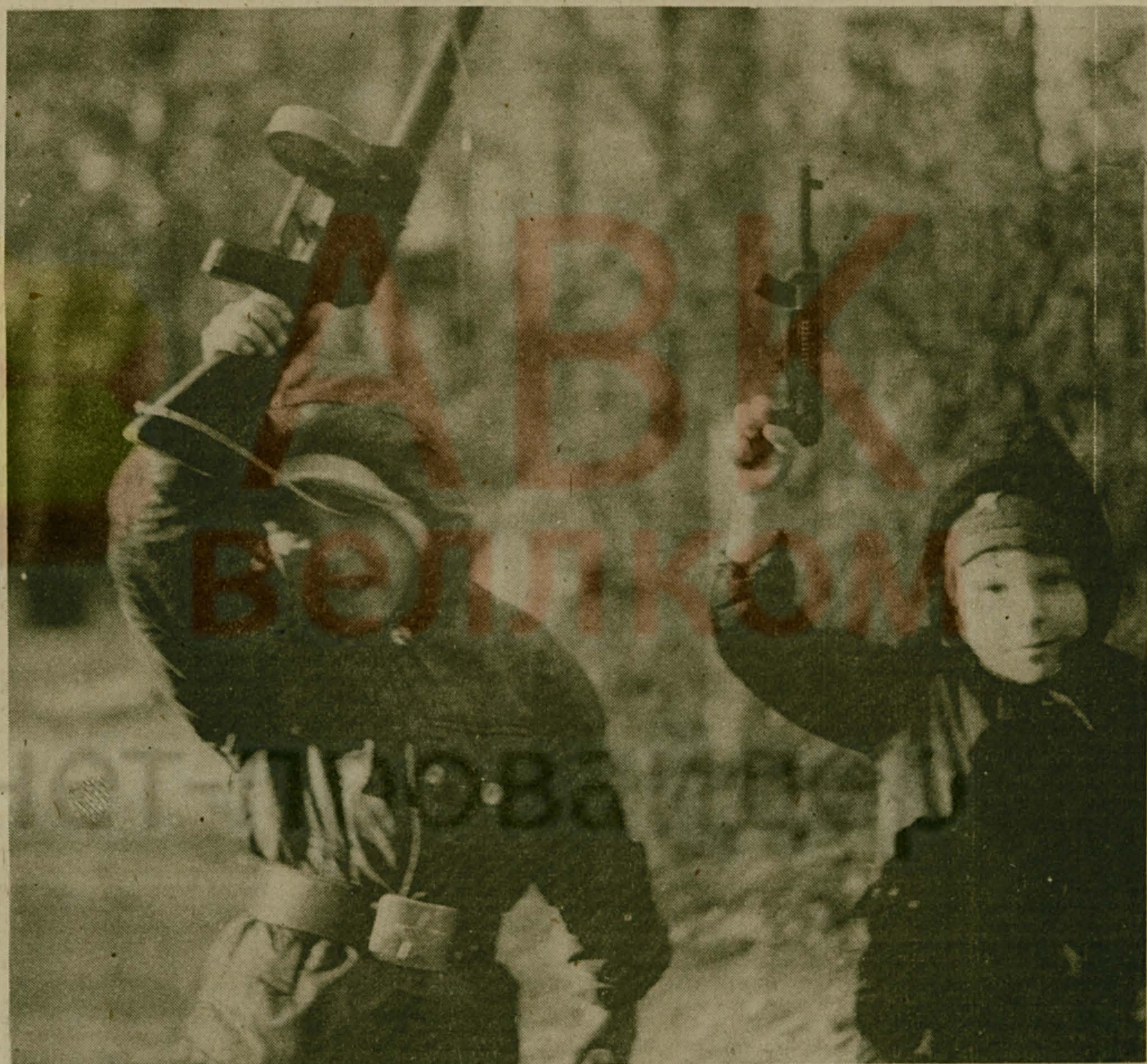
Мальчишки играют в войну...

Мы опросили 80 третьеклассников. 24 из них желают, что им не суждено стать пионерами. 22 юных респондента об этом ничуть не жалеют. Как ни странно, но 34 человека даже не имеют на этот счет мнения.