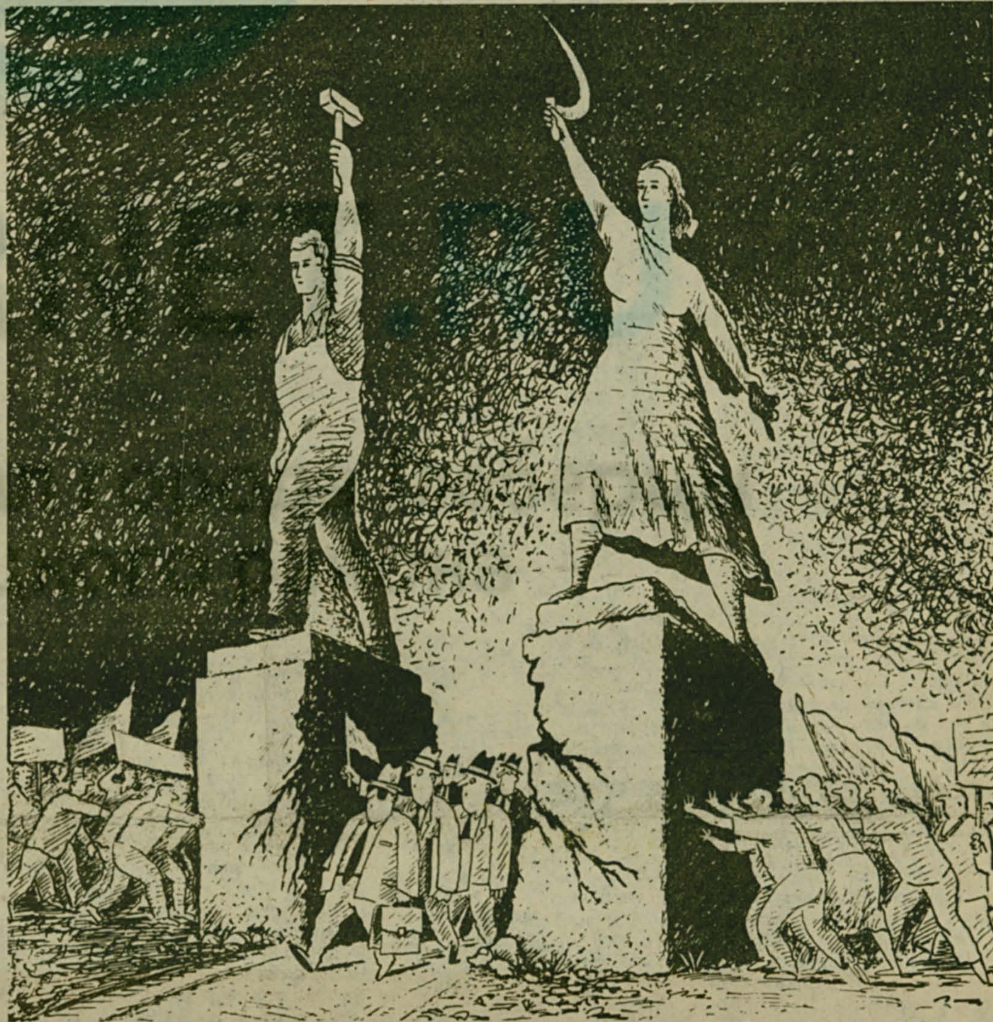
Рис. А. Умярова.