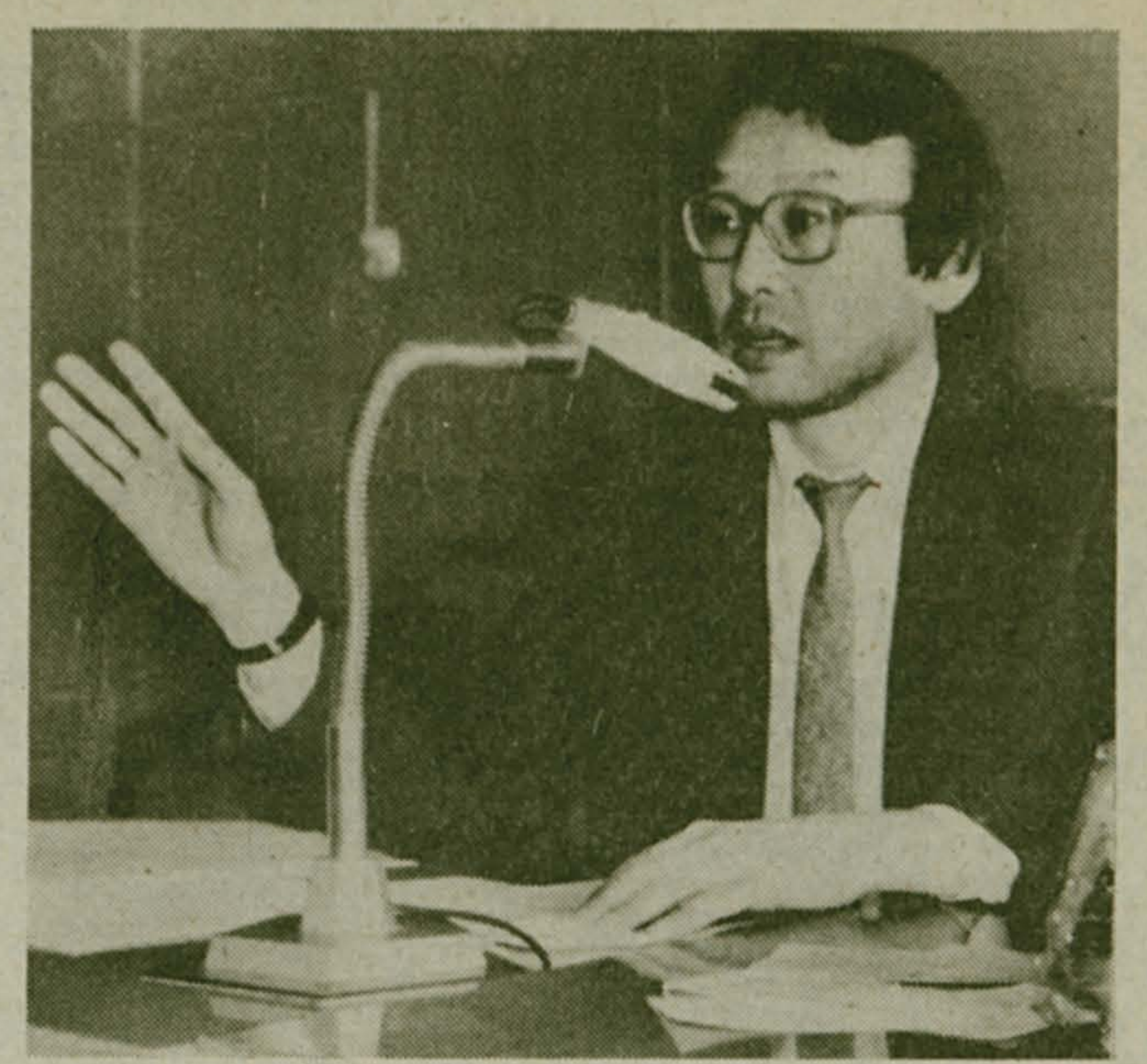
19 марта для Московской областной универсальной биржи (МОУБ) — день первых торгов.