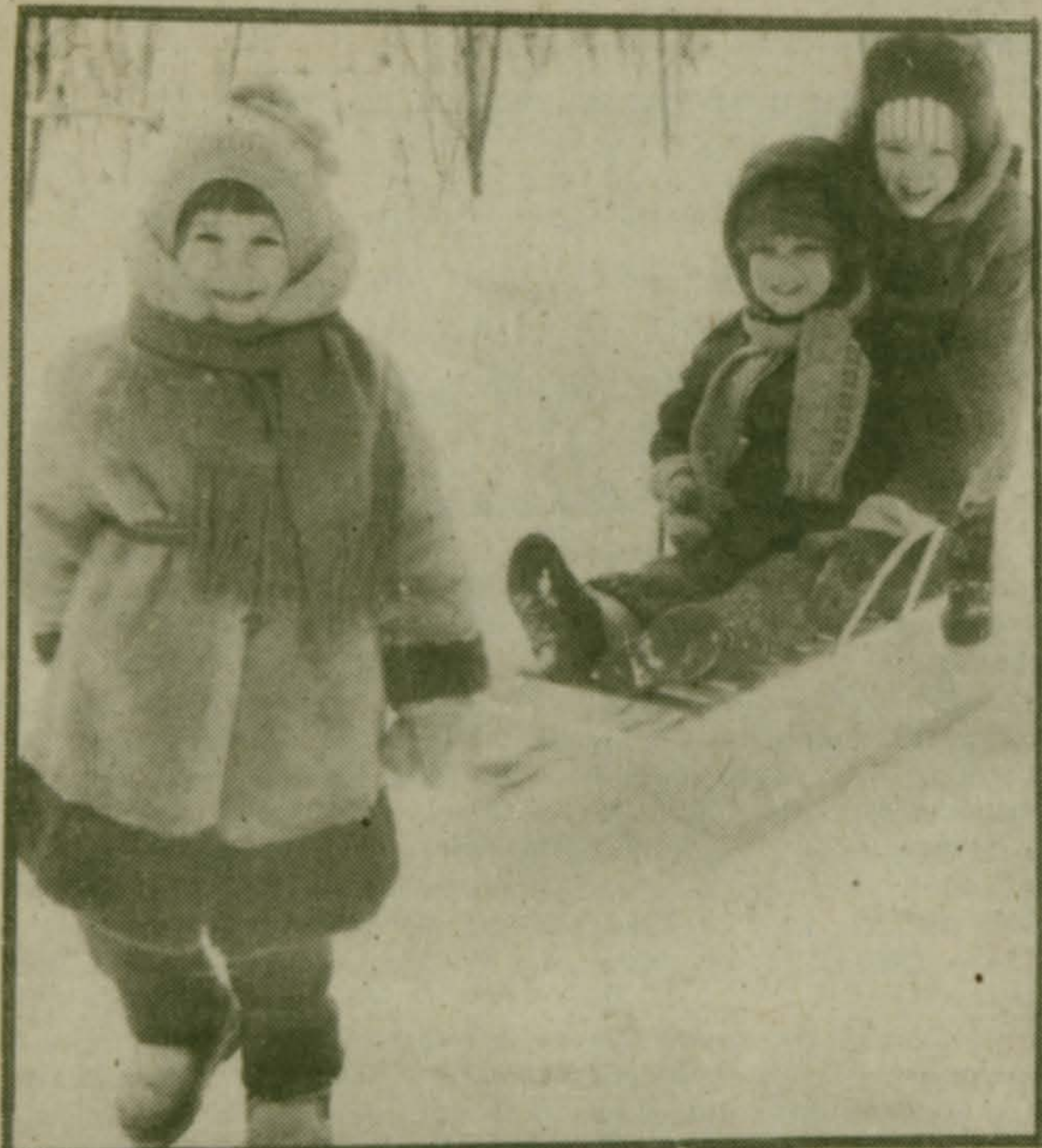
Фоторепортаж С. АНТОНОВА.