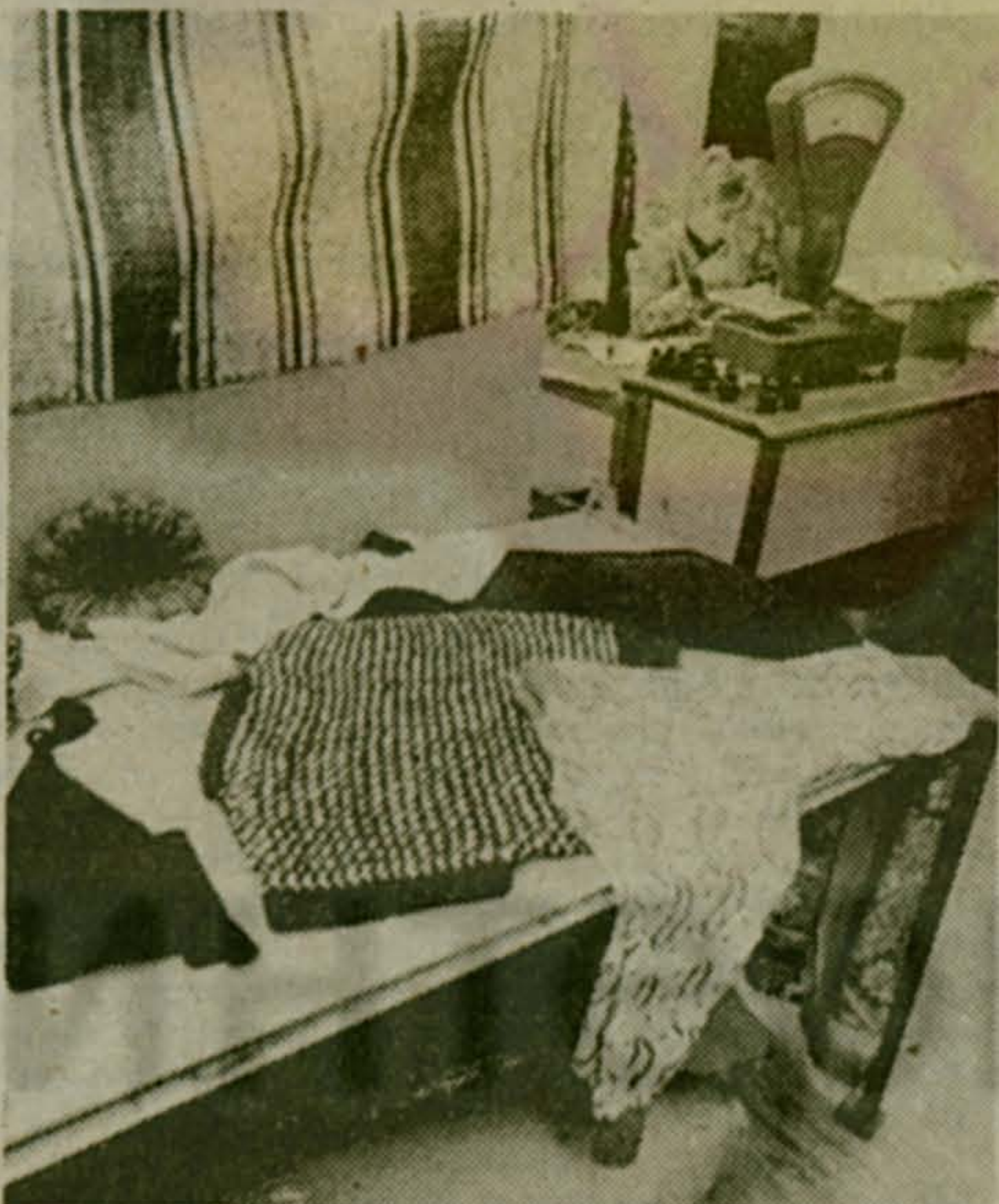
«Из бабушкиного сундука»