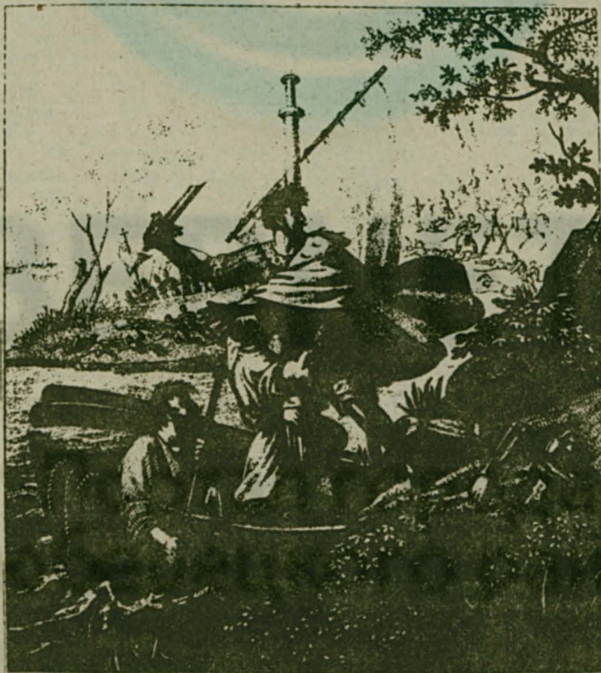
Фоторепродукция с гравюры «Князь Галицкий Мстислав, проиграв сражение при Калке, спасается за Днепром. 1224 год».

Взяв Волжск Ламский, Тверь, Торжок и не дойдя чуть более ста километров до Новгорода, Батый повернул свое войско и подошел к Козельску. Семь недель стояла крепость, а когда стены ее были разрушены, жители бросились на неприятеля и, положив более 4000 врагов, полегли сами. Хан велел умертвить в городе всех, даже младенцев, назвав его «злым городом». Южная Русь ждала неприятеля, но Батый, как бы утомленный убийствами и разрушениями, отошел на время в половецкие степи.