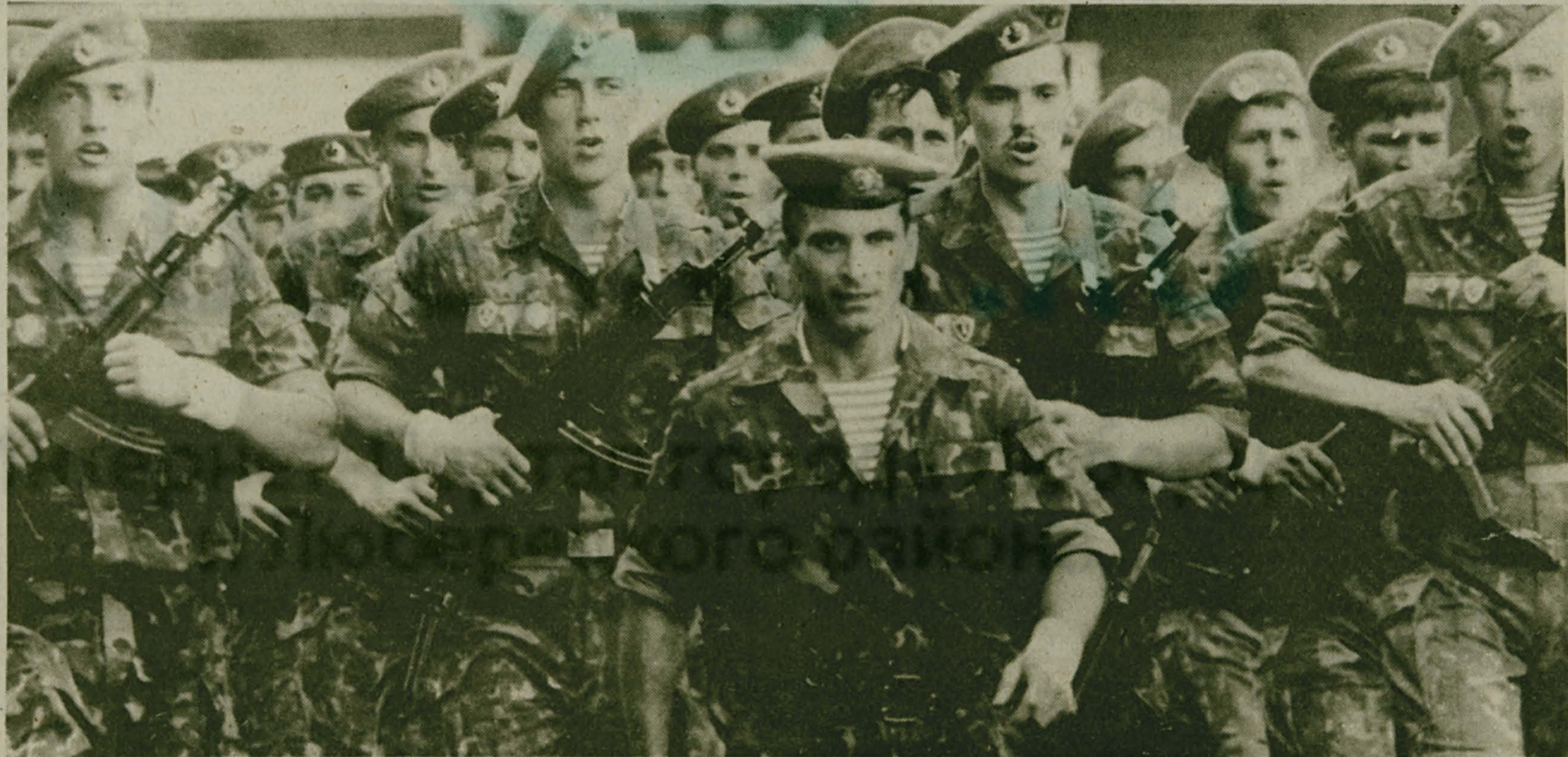
Путь далек и нас с тобою...