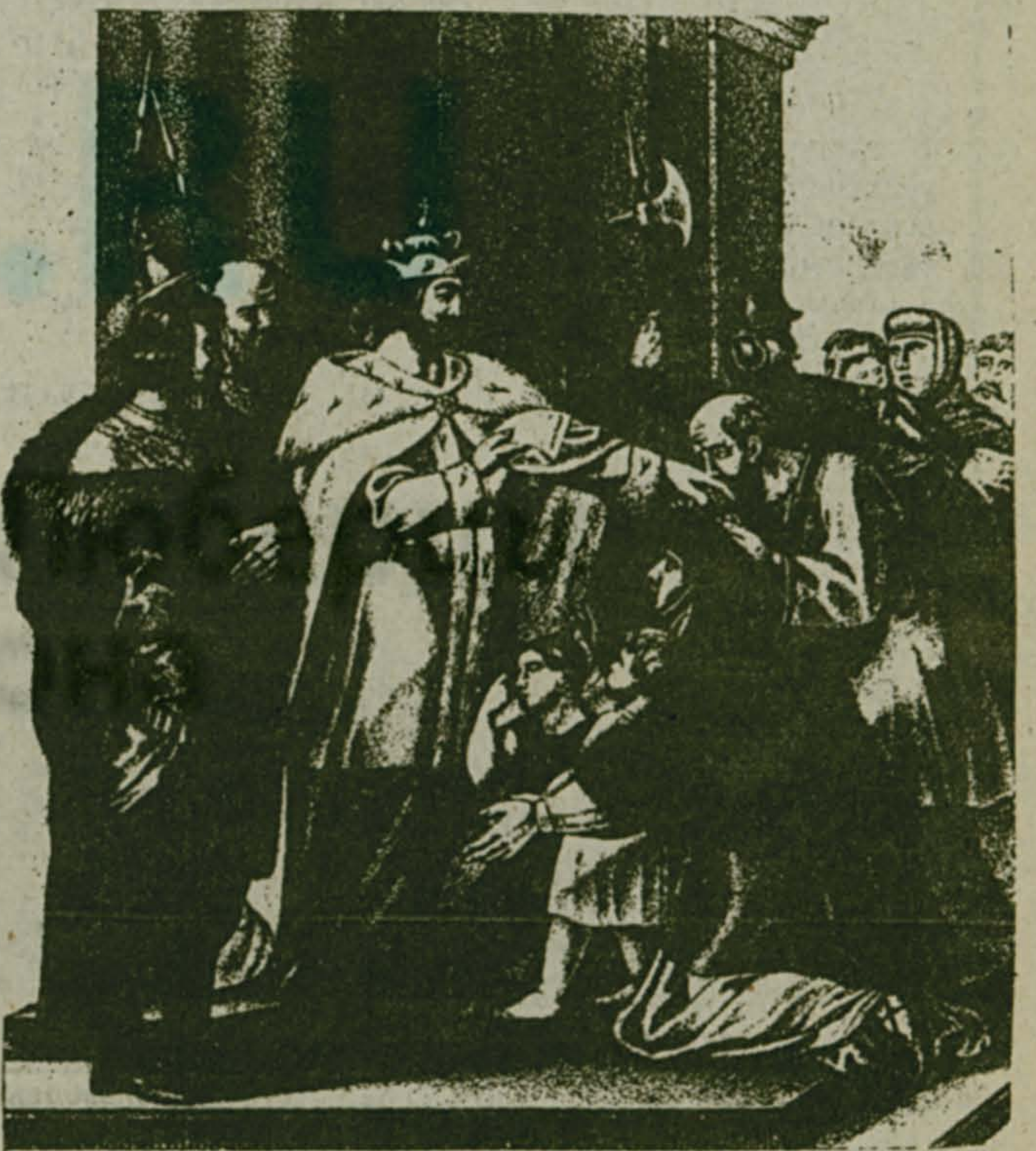
Фоторепродукция с гравюры «Милосердие Андрея Боголюбского».

В это время крепло Владимиро-Суздальское княжество. Усиливалось влияние его князя на юго-западной Русь.