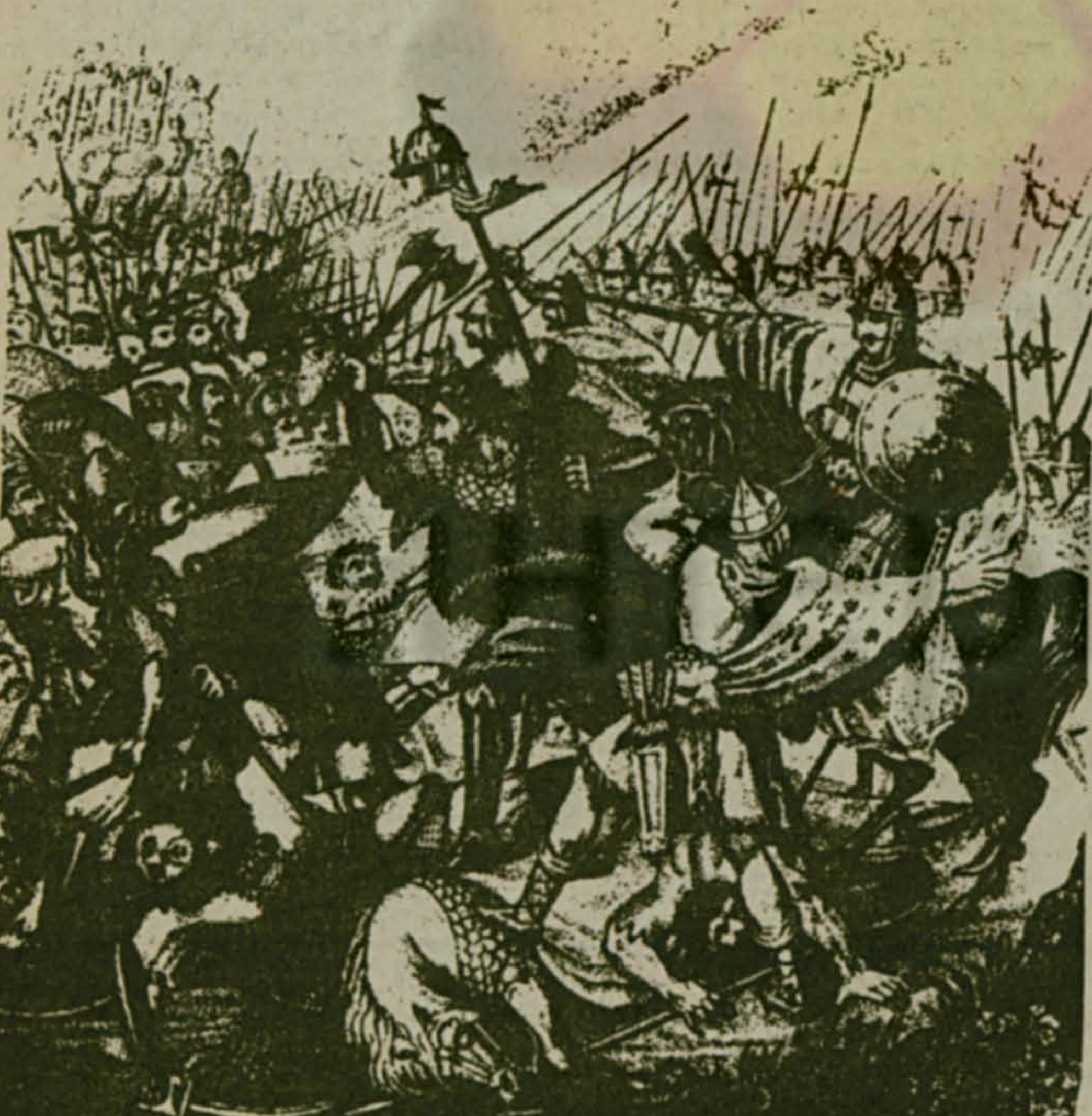
Фоторепродукция с гравюры «Война с половцами, 1169».

На иллюстрации вверху: Мстислав Владимирович (слева) и Прополк II Владимирович (справа).