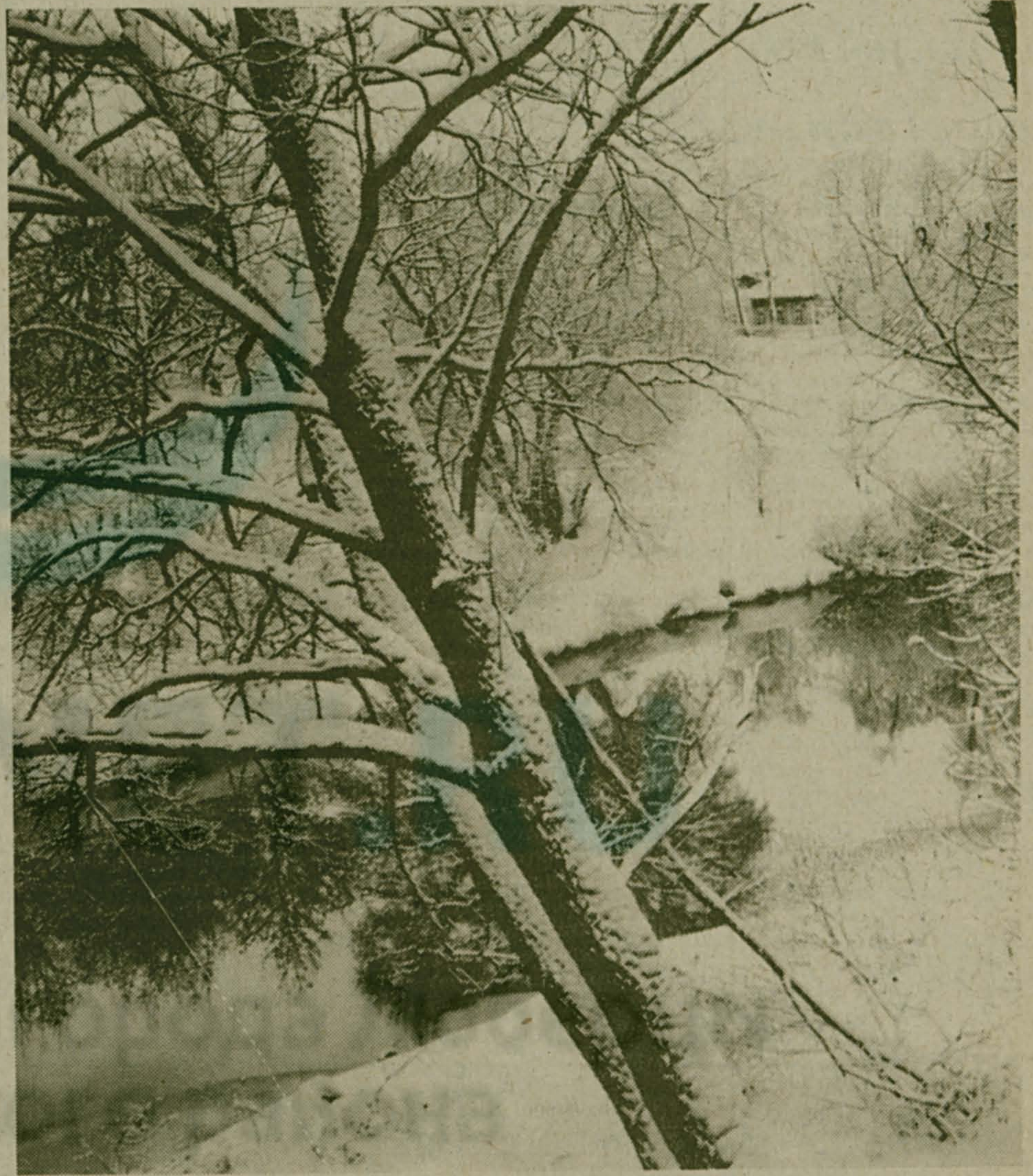
Шуба бела весь свет одела.