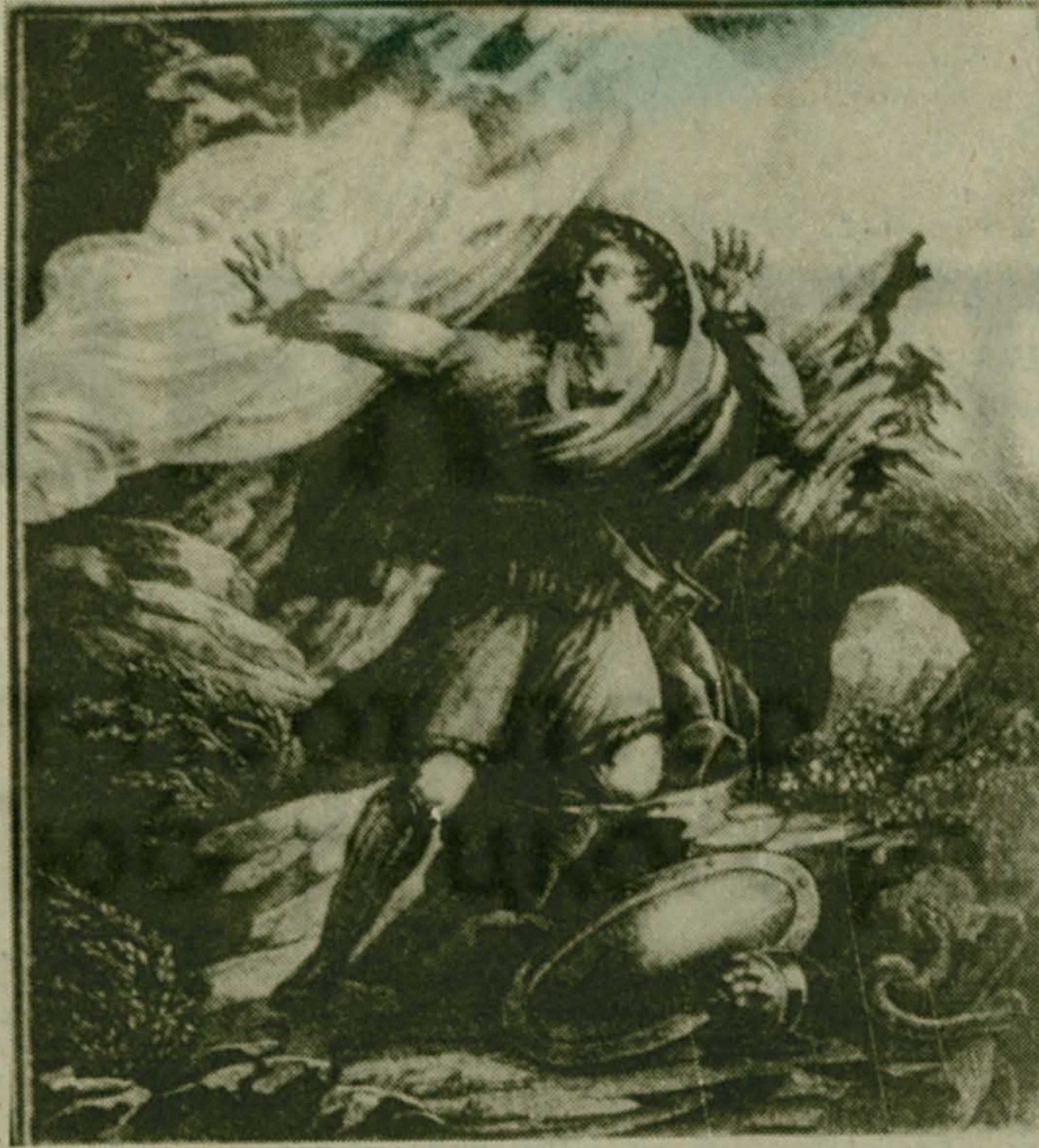
Фоторепродукция с гравюры «Святополк окаянный».