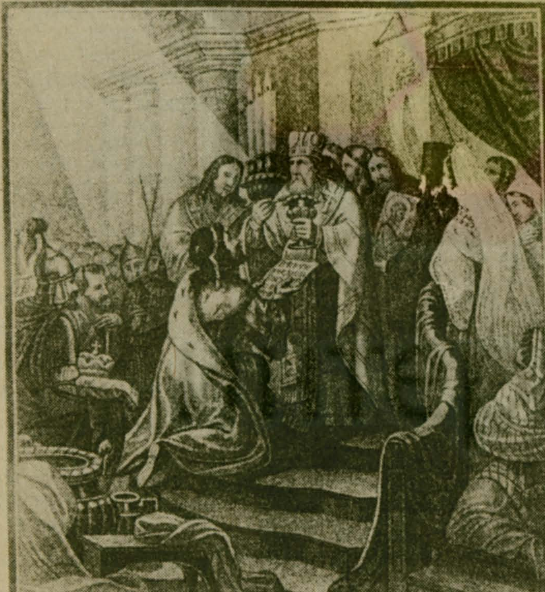
Фоторепродукция с гравюры «Принятие Владимиром христианской веры».

К портрету Всеволода необходимо добавить, что этот князь был образован и мог общаться на пяти языках.