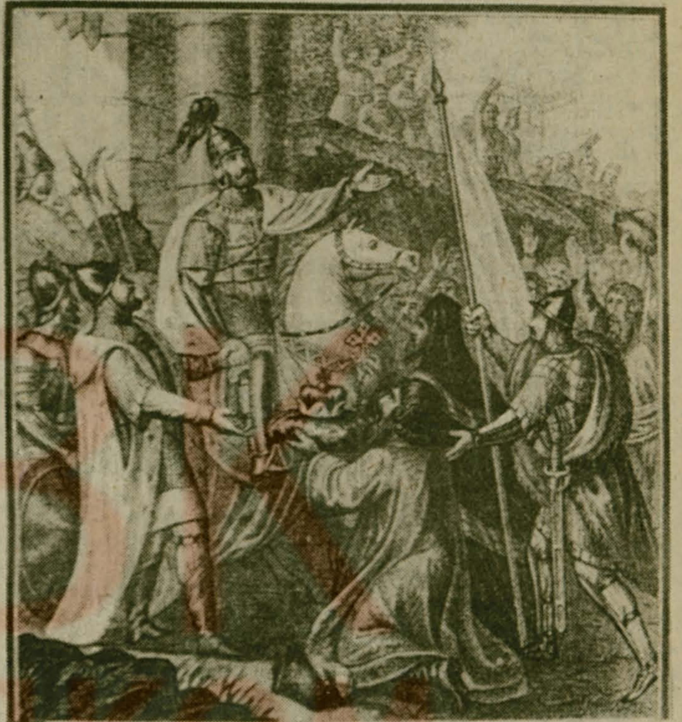
Фоторепродукция с гравюры «Великий князь Изяслав».

В 1068 г. на юге России появился новый кочевой народ — половцы. Они заняли южные степи и стали совершать набеги на русские поселения. Изяслав пытался отразить врагов, но потерпел поражение. Киевляне вторично хотели сразиться с половцами, прося Ярослава дать им оружие и коней, но он воспротивился этому. Отказ поссорил его с киевлянами, дом его был разграблен, а сам князь бежал в Польшу. Святослав занял киевский престол, который и удержал до самой смерти. После его смерти Изяслав снова занял киевский престол, но погиб в междоусобной борьбе с племянниками Олегом Святославичем и Борисом Вячеславичем.