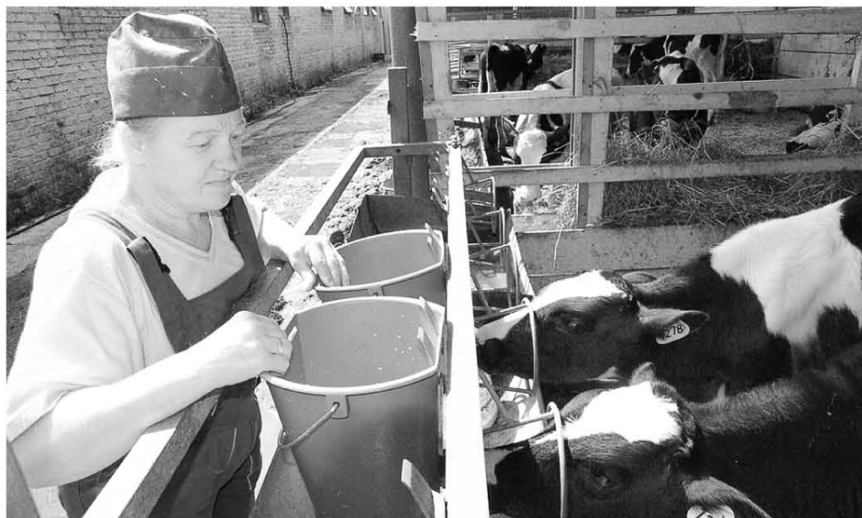
В «Кленово-Чегодаево» активно переходят на новые технологии содержания животных.