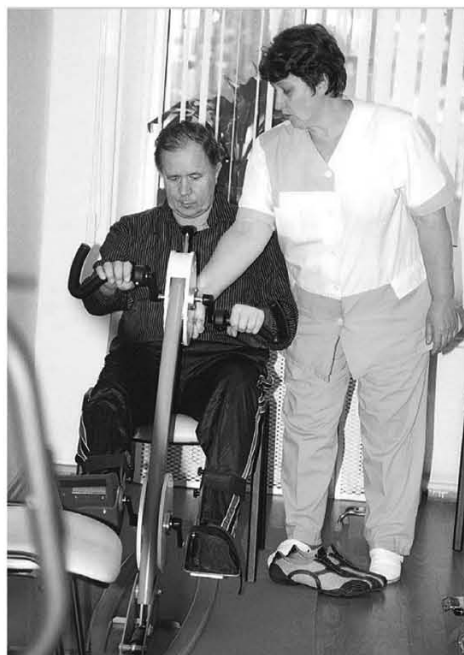
При многих центрах работают кабинеты лечебной физкультуры.

Работа центров не является чем-то застывшим. По мере их функционирования день ото дня появляется что-то новое. Сегодня в регионе идет об-