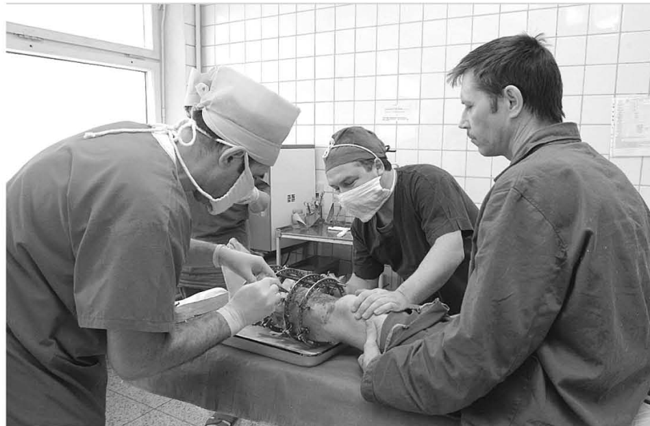
Подмосковным медикам не привыкать к большим нагрузкам...

Но у нас накоплен опыт по освоению больших объемов средств при непрерывающемся процессе оказания медицинской помощи, то есть в режиме текущей работы учреждений здравоохранения. Устанавливать оборудование в таких условиях относительно просто, а вот проводить капитальный ремонт в действующих ЛПУ – проблематично. Но, повторю, такой опыт у нас есть, например, в МОНКИ им. М.Ф.Владимирского, Московском областном научно-исследовательском институте акушерства и гинекологии, областном госпитале ветеранов войн, об-