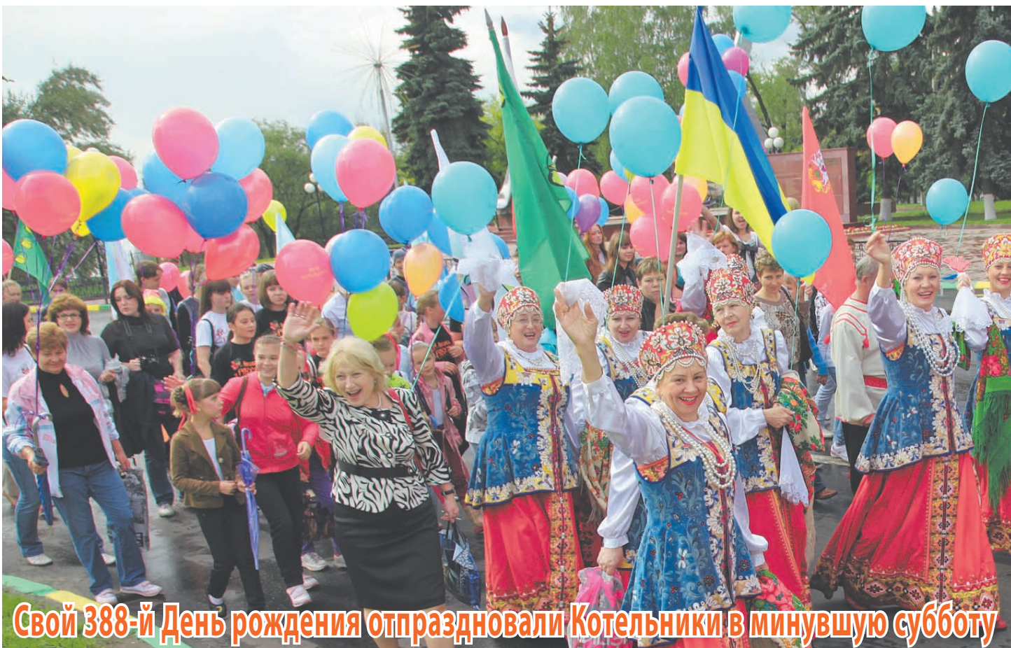
Свой 388-й День рождения отпраздновали Котельники в минувшую субботу

Отпраздновали ярко, многолюдно. Вот уж действительно на этом празднике и стар и млад – все веселились от души. Да ещё с самого утра этого замечательного дня всем нам везло: дождь пролился на землю ещё до того, как от Туевой аллеи тронулась колонна горожан к стадиону «Здоровье», где всё уже было готово к празднику.