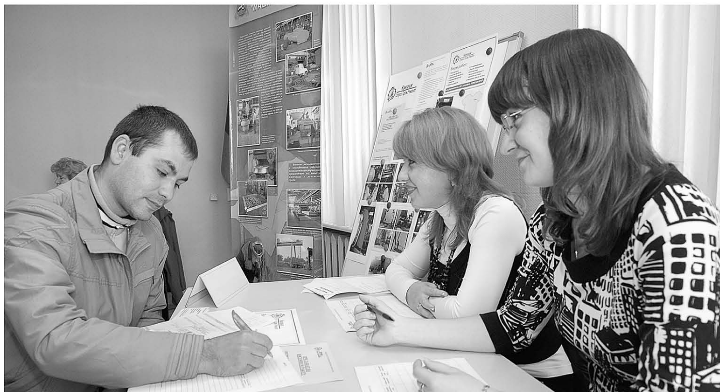
Ярмарка вакансий и учебных мест – это прямой диалог с тем, кто готов взять вас на работу.

На 55,5 тысячи вакансий сегодня в Подмосковье приходится 28,1 тысячи граждан, официально признанных безработными