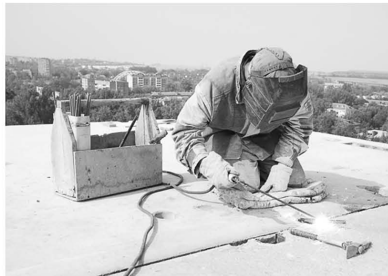
В Подмосковье потребность в сварщиках составляет 50 процентов от необходимого.

Кстати, в скором будущем планируется повысить статус среднего профобразования до высшего. Планируется включить в систему вузов часть колледжей и таким образом создать технический бакалавриат – образование, которое можно будет получить за два-три года, но оно будет считаться высшим.