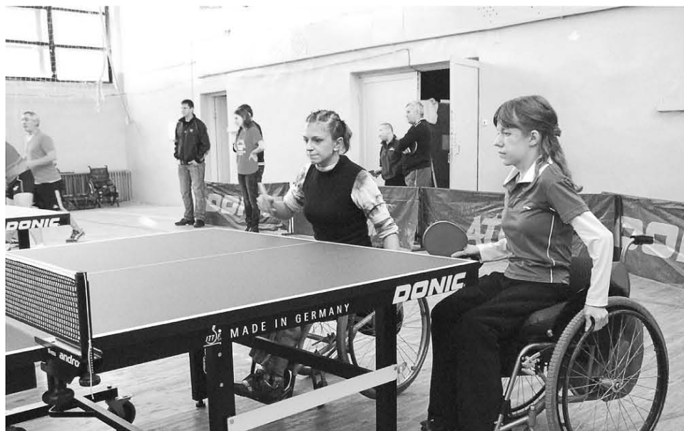
В МУ «Спортивно-оздоровительный клуб инвалидов «Риск - М» удалось найти работу 12 инвалидам.

На 1 ноября 2010 года в городе зарегистрировано 30 предприятий и организаций, имеющих численность более 100 человек. Центр заня-