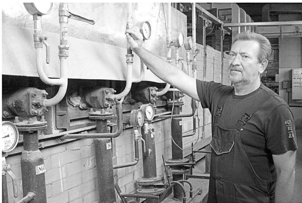
Фильтрующие элементы и установки на их основе по многим параметрам превосходят существующие в мире аналоги, поэтому пользуются широким спросом не только в России, но и за рубежом. Более 150 000 поставляются ежегодно в США, Австралию, Индию, Чили, Словению, страны СНГ.

СЕГОДНЯ ПРЕДПРИЯТИЕ ПРОИЗВОДИТ ДО 90% ОБЪЕМА ВСЕХ ВЫПУСКАЕМЫХ В СТРАНЕ ЭЛЕМЕНТОВ ИЗ КЕРАМИКИ ДЛЯ ФИЛЬТРАЦИИ.