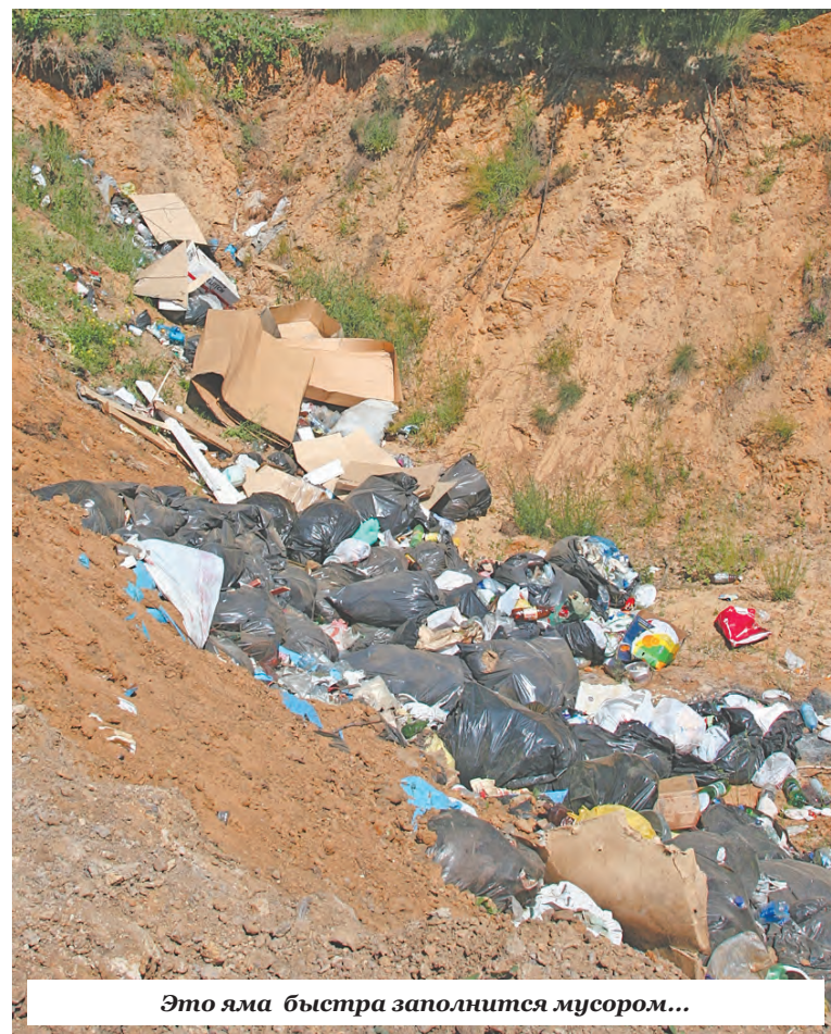
Это яма быстра заполнится мусором...