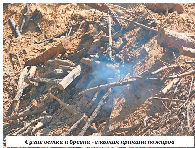
Сухие ветки и бревна - главная причина пожаров