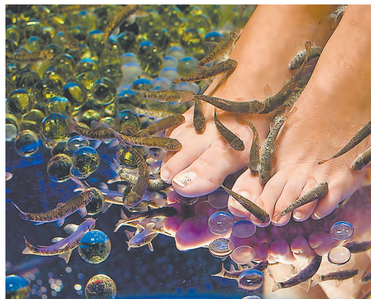
Полосу подготовила Виолетта Бани

распространяться по всему свету. Человек приходит в специальный салон, опускает ноги в водоем или погружается в него полностью, и маленькие рыбки гарра руфа начинают нежно покусывать его тело. Процедура эта приятная и совершенно безболезненная. Помимо косметического эффекта эти рыбки помогают бороться с такими заболеваниями, как псориаз, экзема и эпидермофития стоп. Зубов у рыбок нет, и они съедают только самый верхний, уже ороговевший слой кожи, не трогая здоровых тканей.