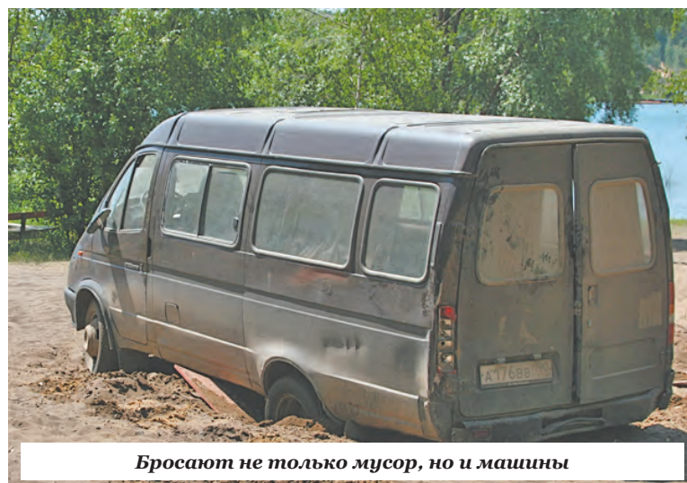
Бросают не только мусор, но и машины