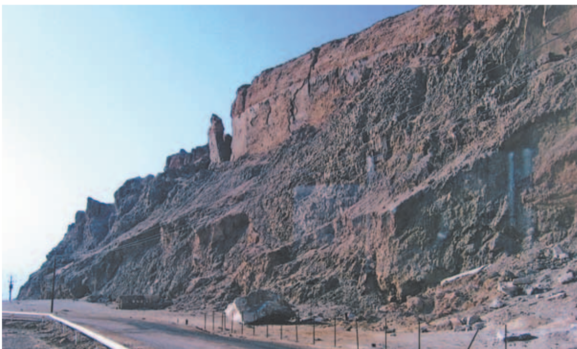
Шоссе «Эйлат - Иерусалим». Вверху и посередине — тот «недостоверный» столп.