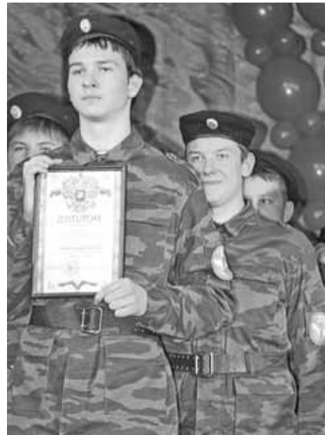
Готов служить России