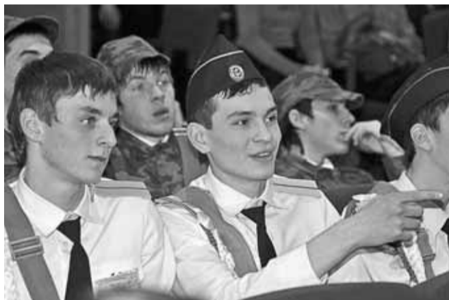
Смотри, ай-да молодцы!