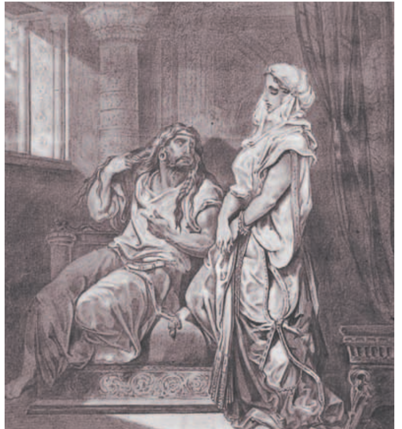
Самсон и Далида.

на Содом дождем серу и огонь от Господа с неба, и ниспроверг города сии, и всю окрестность сию, и всех жителей городов сих... Жена же Лотова оглянулась позади его и стала соляным столпом... Мораль № 1 (преимущественно для женщин) здесь совершенно очевидна: накладным бывает избыточное любопытство! Не менее явна мораль № 2, адресованная мужчинам, тоже не менее прозрачна: в экстремальных ситуациях никогда не ослабляйте контроль за импульсивными спутниками - вдруг не туда посмотрят, окаменеют (точнее, осолоненют), и зачем вам потом столько соли?!