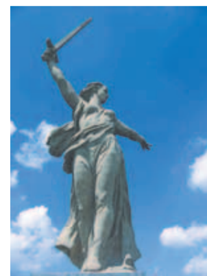
Подготовила Вioletta Бани

2 февраля - День воинской славы России. В 1944 году в этот день советские войска разгромили немецко-фашистскую армию в Сталинградской битве.