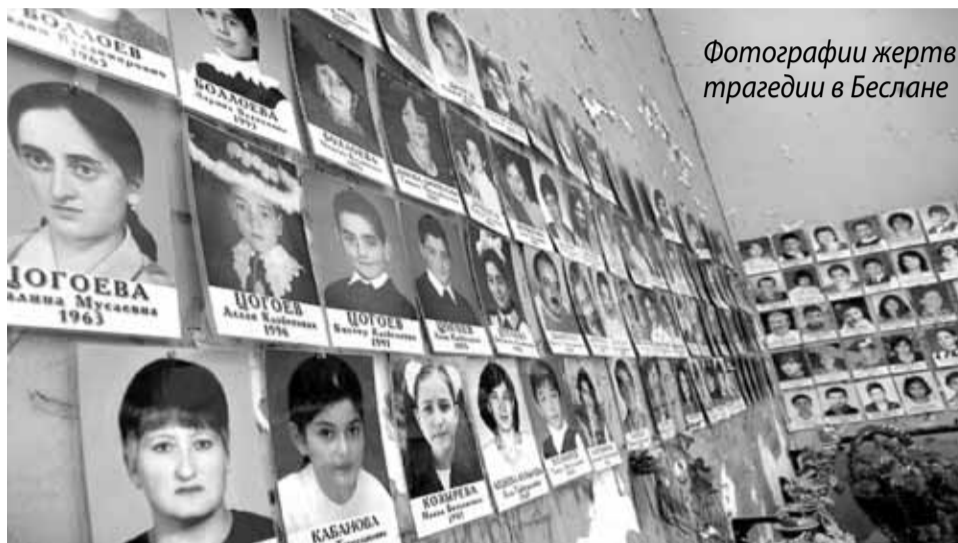
Фотографии жертв трагедии в Беслане

Всего десять месяцев назад в столичном метро на станциях «Лубянка» и «Парк культуры» произошел чудовищный террористический акт. Тогда погибли сорок человек и более шестидесяти получили ранения. Мы все еще не оправились от той страшной трагедии, многие до сих пор боятся ездить в метро. И вот новая трагедия. 24 января в 16.30 в крупнейшем московском аэропорту «Домодедово» сработало, по версии следствия, - приведенное в действие шахидом, взрывное устройство. В результате теракта погибли 35 человек, 116 получили ранения различной степени тяжести.